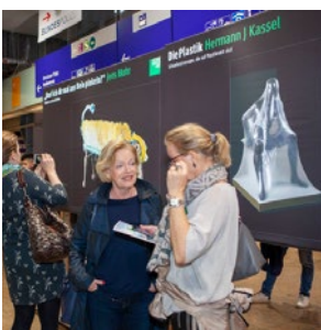
Vernissage der Ausstellung im «Mein Einkaufsbahnhof» am Standort Köln Hbf am 17. Oktober 2019

Die Ausstellung wird im ersten Schritt in den hochfrequentierten Gebäuden der acht größten Hauptbahnhöfe in NRW umgesetzt. Startschuss für die Ausstellung war die Vernissage am 17. Oktober 2019 in Köln. Für die weiteren Ausstellungsorte suchen wir pro Stadt jeweils nach einem „Local Artist“. Der lokale Künstler wird in die Gesamtkommunikation des Projekts aufgenommen. Dein Werk wird in Deiner Stadt und zum Abschluss der Tour in Berlin Hbf zu sehen sein.